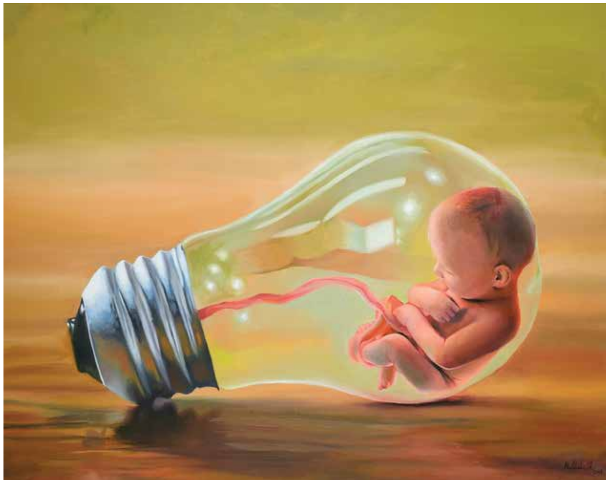
We are all for the Homeland , Oil on canvas, 150 * 120 cm, 2018