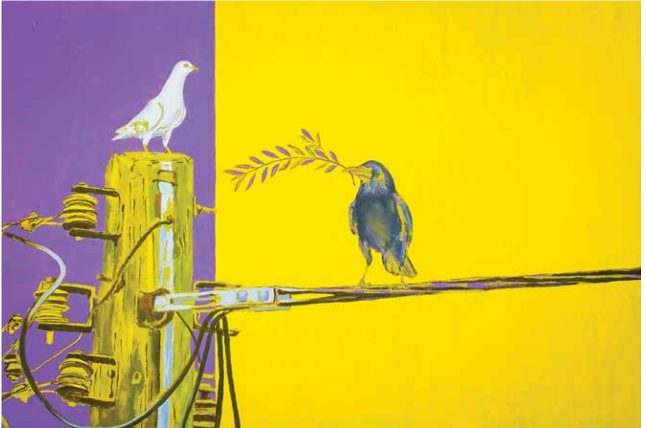
Coexistence , Oil on canvas, 150 * 100 cm, 2018