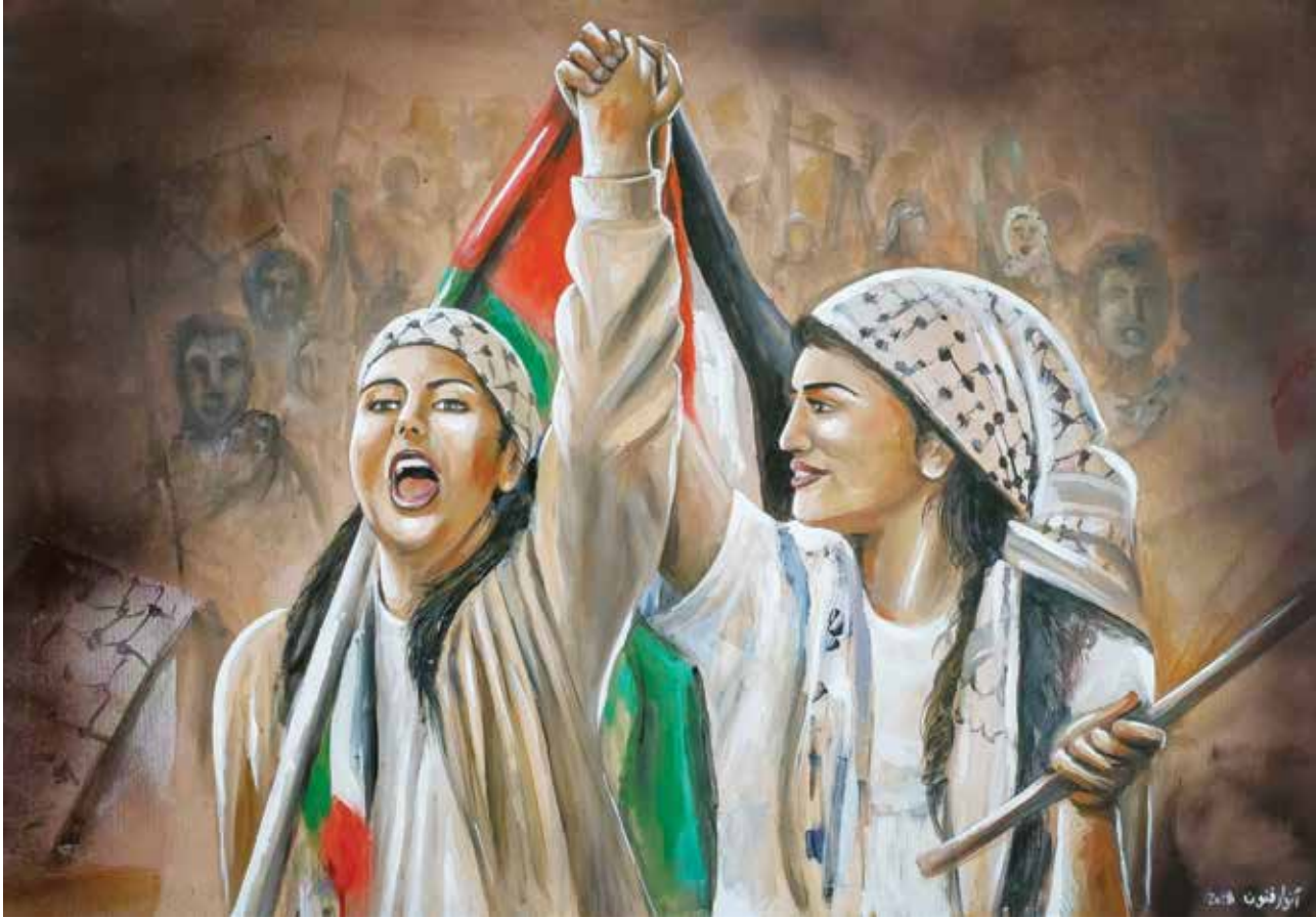
We are all for the Homeland , Acrylic on canvas, 100 * 80 cm, 2018