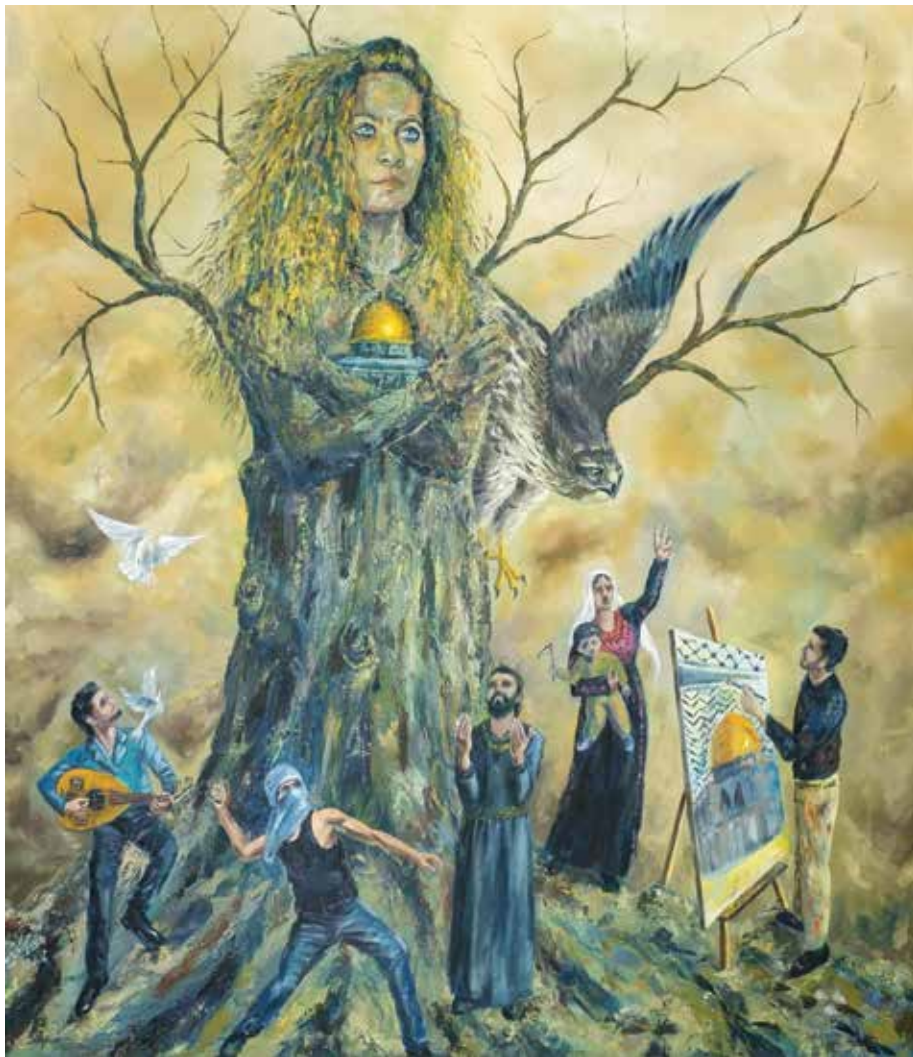
Ahed – the Homeland Promise