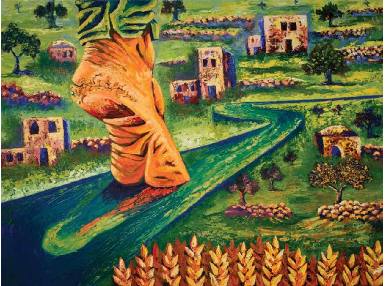
Untitled , Acrylic on canvas, 80 * 60 cm 2018